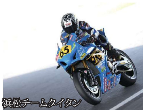
浜松チームタイタン