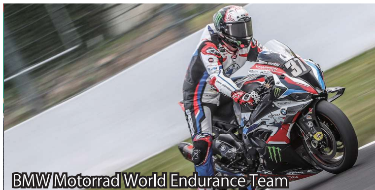
BMW Motorrad World Endurance Team