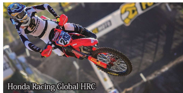
Honda Racing Global HRC