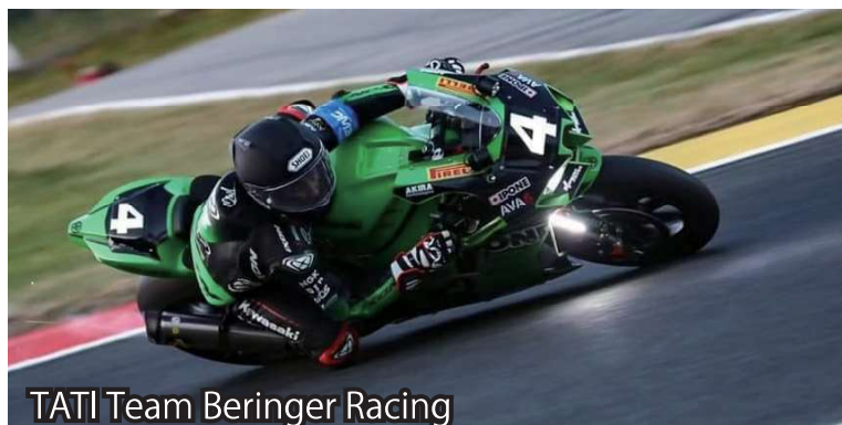
TATI Team Beringer Racing