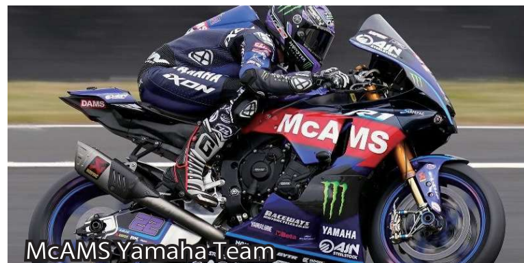
McAMS Yamaha Team